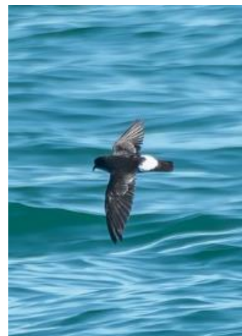
Bernaches cravants (haut), Fou de Bassan adulte (bas gauche) et Océanite tempête (bas droite).

Aux alentours de midi le capitaine coupe le moteur sur une mer calme au milieu des goélands et Fous de Bassan . Un Grand Labbe fait un passage sans s'attarder puis quelques Océanites tempêtes tournent autour du bateau à distance respectable. Depuis le toit du bateau une observatrice remarque un Puffin des Baléares qui se rapproche. La pause midi est ponctuée par les nombreux groupes de Pipits farlouses en migration et quelques Bergeronnettes grises .