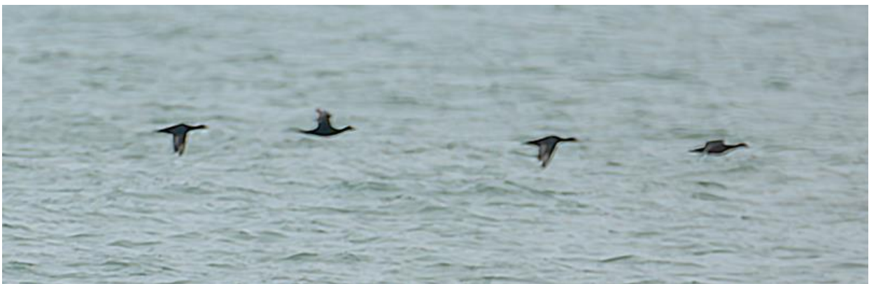
Balbuzard pêcheur (haut gauche), Bergeronnette grise (haut droite) et Macreuses noires (bas).

Une fois passé le phare de Chassiron nous mettons le cap plein est vers 2 chalutiers accompagnés par des centaines d'oiseaux. Une dizaine de goélands (marins, brun et argenté) nous rejoignent et nous suivent, attirés par les morceaux de poissons régulièrement jeté dans le sillage du