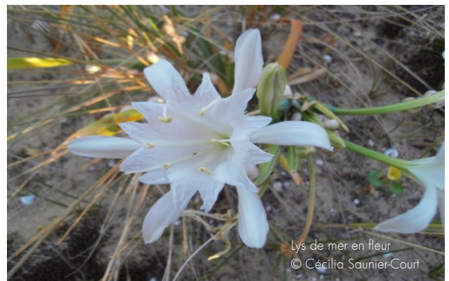
Lys de mer en fleur

La LPO a été sollicitée pour rééditer l'opération nichoirs de Sainte-Marie. Plusieurs communes du canton sud très intéressées ont pris date... Il se murmure que la Communauté de Communes serait aussi sur le coup... Pourquoi pas une opération 1 000 nichoirs dans nos communes rétaises? Cela aurait de l'allure et par les temps qui courent, c'est bon pour le moral! En cours avec la LPO et Grégory Ziebac