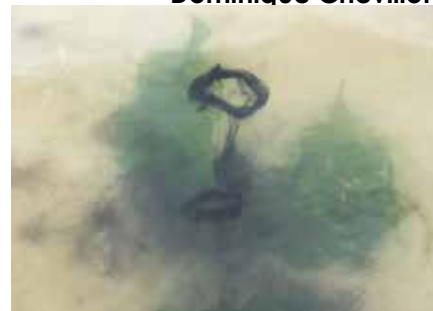
Jet d'encre