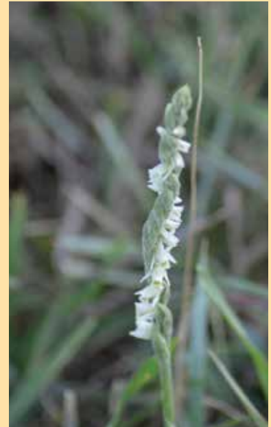
Spiranthes spiralis (L.) Chevall.

Spiranthes spiralis (L.) Chevall. ou la Spiranthe d'automne est une plante annuelle, appartenant à la famille des Orchidaceae . Elle mesure jusqu'à 60 cm. Elle fleurit d'août à octobre. Elle est pollinisée par les insectes. On l'appelle aussi Spiranthe spiralee. C'est une plante grêle. La tige est vert grisâtre, pubescente. Elle est entourée de 3-7 gaines. Elle a 3-7 feuilles. Ces dernières sont glabres, glauques, ovales à elliptiques, acuminées, en rosette à côté de la tige fleurie. Ses bractées sont longues de 6-7 mm, plus longues que l'ovaire, pubescentes en dehors. L'inflorescence est lâche, haute de 3-15 cm. Elle a 6-30 petites fleurs blanc verdâtre. Les fleurs se développent sur une seule ligne, enroulée en hélice le long de la tige florifère d'où le nom d'espèce . Les sépales et pétales sont subégaux, oblongs. Le sépale dorsal et les pétales forment avec le labelle un tube campanulé étroit. Les sépales latéraux sont étalés. Son labelle est oblong, canaliculé, jaune verdâtre bordé de blanc, muni à la base de 2 nectaires visibles, le sommet élargi, fortement crénelé.