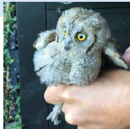
Hibou petit duc

IMPORTANT : les rapaces nocturnes comme ce petit duc