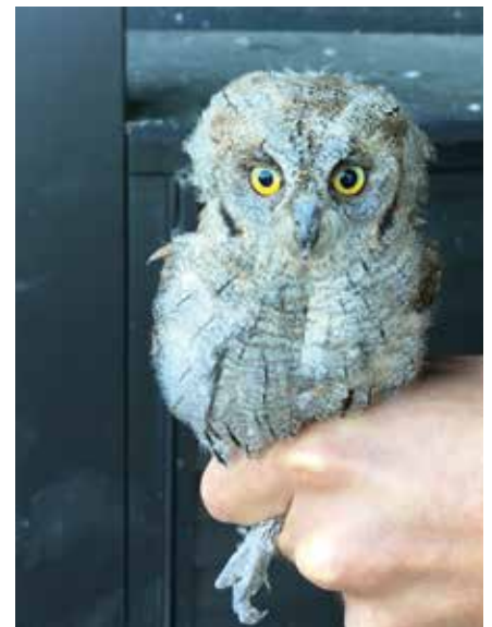
Hibou petit duc

Très gros passage, 3ème semaine de septembre, de ce petit passe- reau qui a gobé, gobé et gobé en vol les insectes de nos jardins !