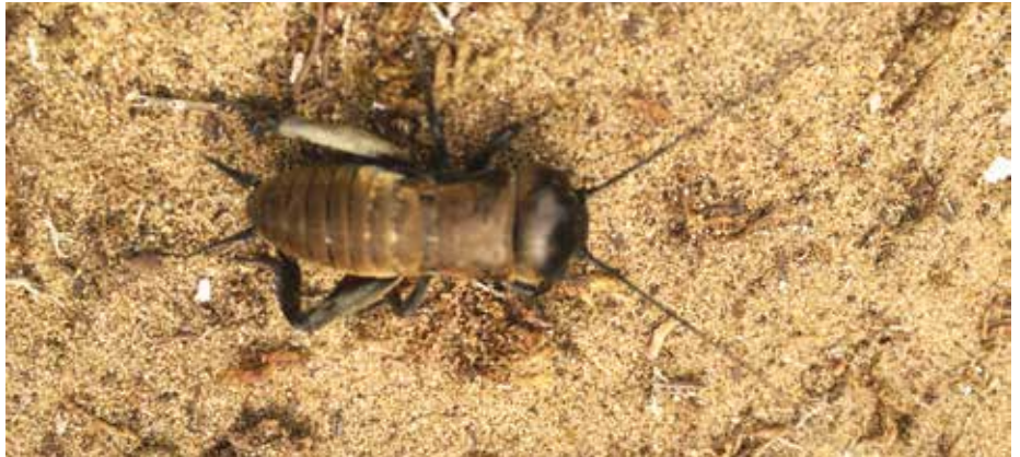
Grillon champêtre