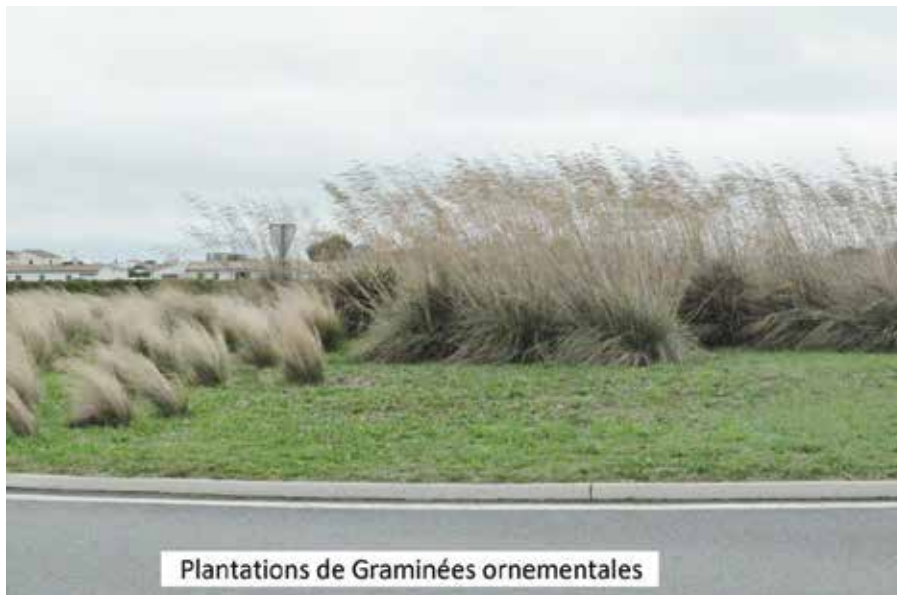
Plantations de Graminées ornementales

Les espèces invasives d'une région sont des espèces qui n'appartiennent pas à la biodiversité locale, mais qui arrivent de territoires éloignés, géographiquement séparés, et qui se développent de façon très importante grâce à des conditions climatiques favorables.