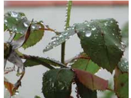
la pluie

Sur Terre aussi, les gouttes ne peuvent pas dépasser 6 mm de diamètre : au-delà, elles sont aplaties par la gravité. Mais dans l'espace, où il n'existe pas de gravité, on a pu observer des gouttes géantes de plusieurs dizaines de centimètres !