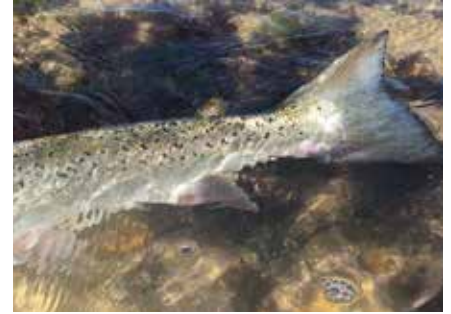
truite de mer

où elles s'y engraisent (~1m et 10 kg) de taille et poids identiques au Saumon mais plus trapues. A la question comment se différencient la Truite de mer et le Saumon , il faut répondre avec beaucoup de prudence tant ces deux espèces au stade adulte comme au stade juvénile présentent des formes variées et confusantes. Trois critères semblent tenir la route : 1) l'extrémité postérieure de la mâchoire ne dépasse pas la moitié de l'oeil chez le Saumon alors qu'elle atteint l'arrière de l'oeil chez la truite 2) la nageoire adipeuse (ou nageoire molle) située entre la nageoire dorsale et la nageoire caudale (la queue) originalité chez ces salmonidés est