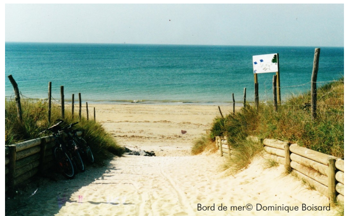
Bord de mer