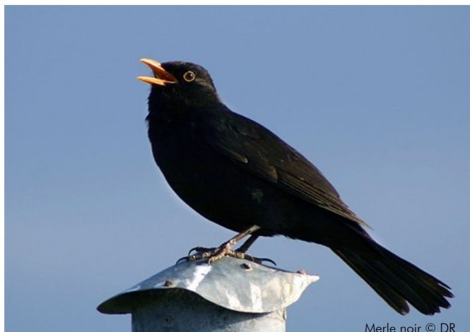
Merle noir

Les couples de merles entrent en amour de bonne heure et peuvent se former dès le début de l'hiver. Mais la richesse et la longueur des chants connaissent paraît-il une apogée quand la femelle est la plus fertile. Ainsi on peut entendre un merle siffler de mars jusqu'au début de l'été.