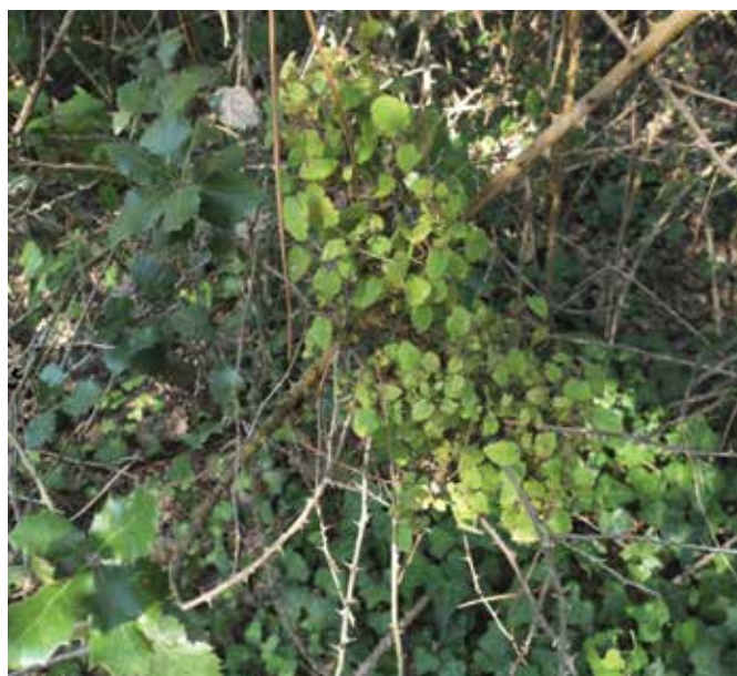
Balai sur Ronce