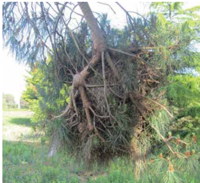
Balai sur Pin

Enfin, existe également le rarissime et magnifique « balai de sorcières » formé uniquement de pommes de pin comme celui trouvé et récolté par notre ami Gilles BRULLON. Avec plus de 60 pommes, il ne peut être confondu avec le simple développement de 5 à 6 pommes voisines, phénomène courant mais des plus naturels.