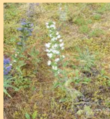
Echium italicum

Sur l'île de Ré, elle fut observée une première fois en 2009. Sa