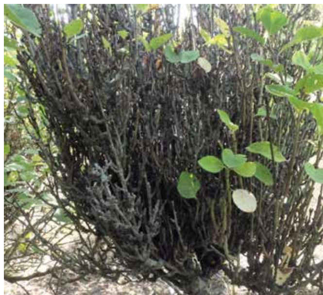
Balai sur Prunelier