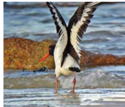
L'Huître pie © Jean-Yves Piel

Ils font leur marché sur et sous les Fucus, attaquant avec force coups de bec une moule ici, détachant une Patelle d'une pierre là. Se servant de son bec comme d'une pioche, un marochon, il avale d'un secoué de bec, le mollusque convoité. Les rencontres fortuites avec un congénère déclenchent sifflets et roulades sonores, cou courbé, bec ouvert vers le sol. L'huître pie en pêche n'apprécie pas la concurrence.