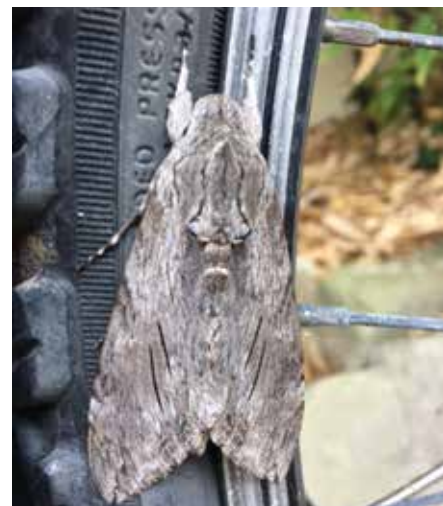
Sphinx du liseron

30 août posé sur un pneu de vélo dans mon jardin, un magnifique Sphinx du Liseron ( Agrius convolvuli ) Lépidoptère de la famille des Sphingidés, appelé aussi cornes de bœufs.