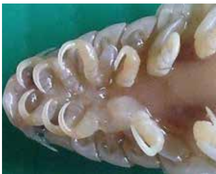
Anilocra frontalis

l'île de Ré, vieilles et jeunes, n'ont cependant rien à craindre car je n'aime pas la chair humaine.