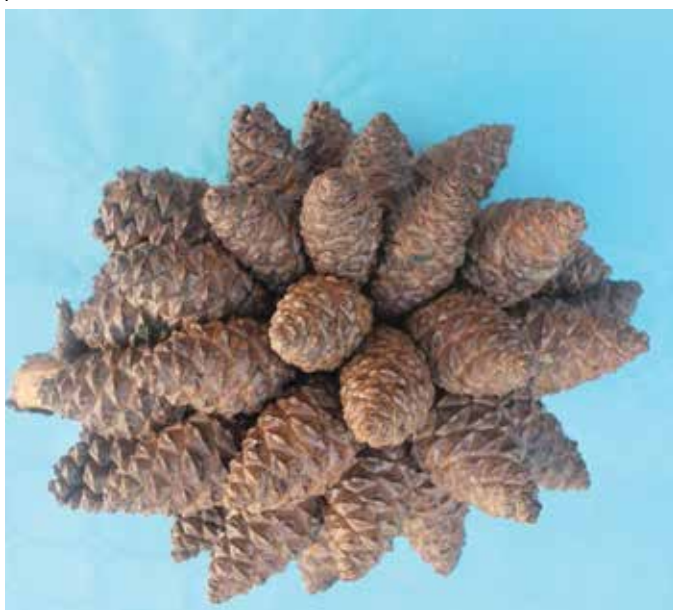
Balai de pommes de pin