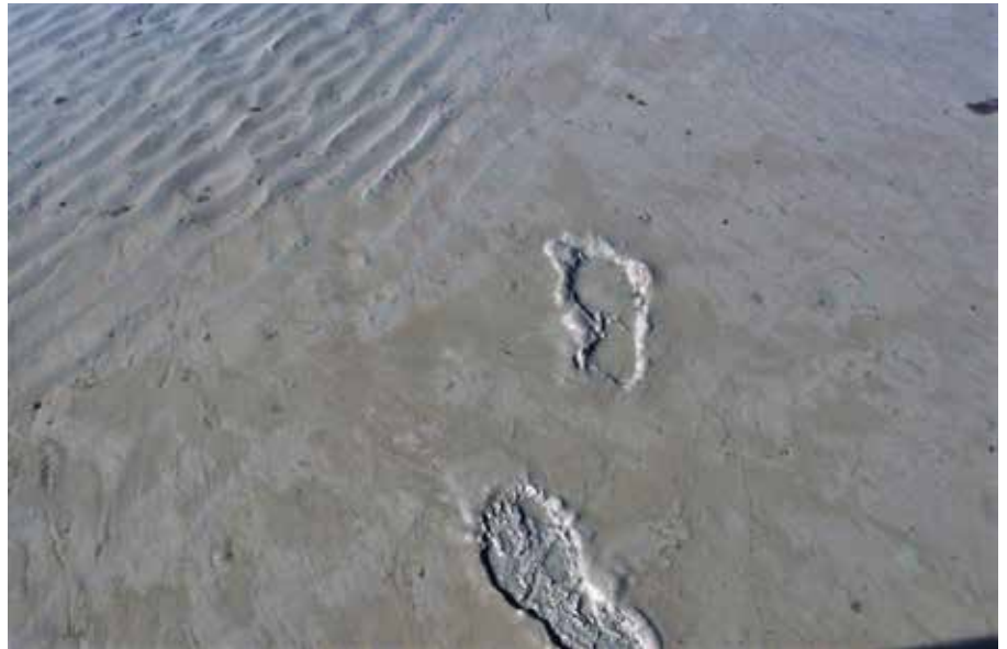
Dépôt de vases sur sable

Les particules fines transportées par les courants suivent toujours le même cheminement. Dans les eaux agitées, elles ne peuvent qu'être transportées. Dès qu'elles arrivent dans des zones de calme (baies, bassins, etc.) elles descendent lentement vers le fond où elles se déposent. Puis si le milieu reste calme, elles vont se consolider très lentement (en plusieurs mois) par élimination progressive de l'eau interstitielle. Mais si une agitation du milieu survient, elles seront décollées du fond et reprendront leurs déplacements au fil des courants. Cela explique pourquoi les vases formées dans les estuaires et qui circulent dans les pertuis