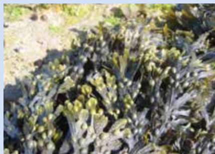
Fucus vésiculeux

En période de reproduction, des renflements fourchus de couleur claire apparaissent en bout de thalles*. Organes de reproduction ils libèrent dans l'eau des mucosités contenant des gamètes mâles