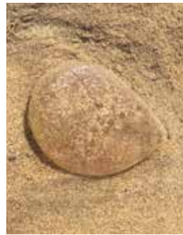
ponte de vers marins