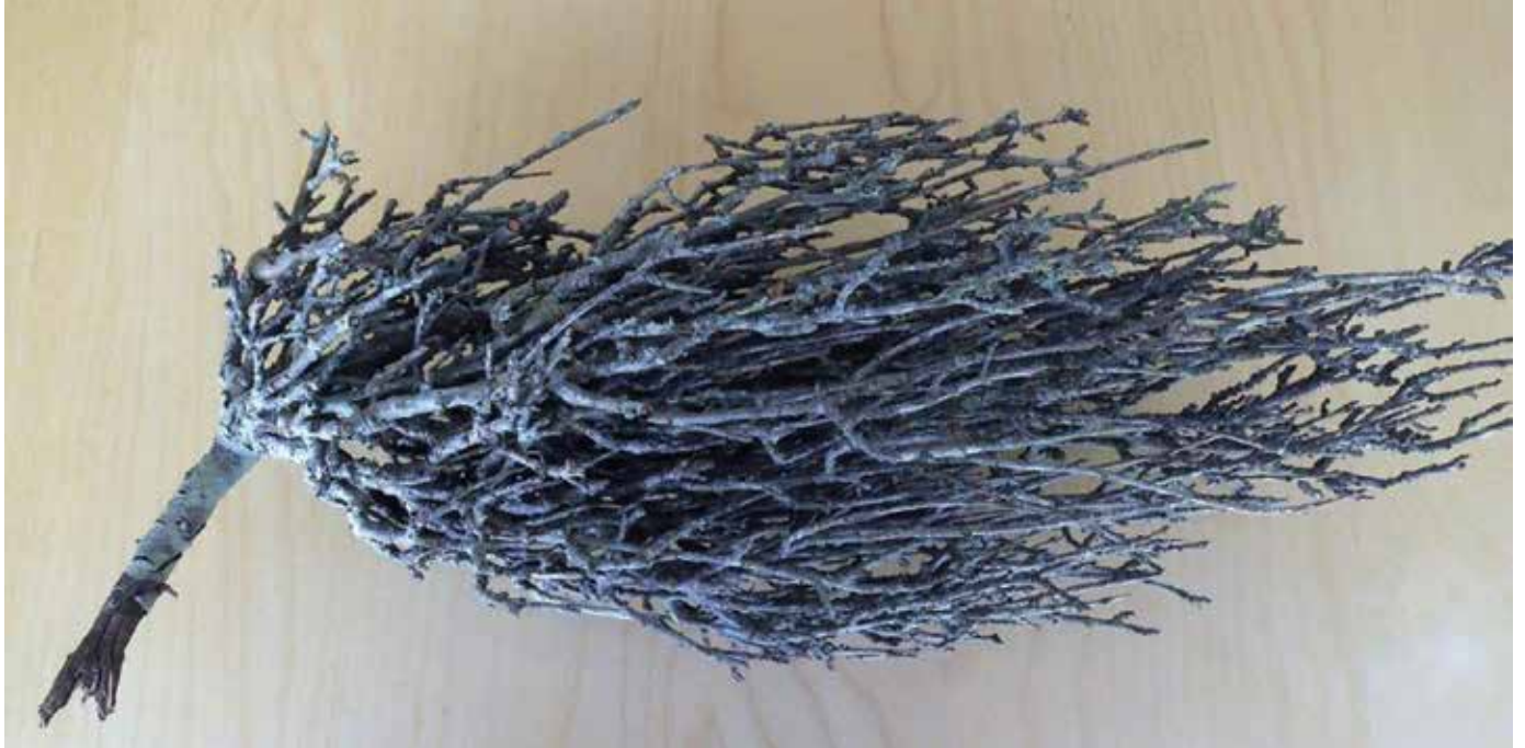
balai de sorcière

Parfois, au cours d'une promenade en forêt, une masse très dense de tiges courtes et de multiples feuilles vertes attire l'attention dans les hauteurs d'un pin maritime. A quoi correspond donc cette manifestation ? C'est un phénomène à la fois très naturel et anormal pour l'arbre concerné. Vu de plus près, la tige normale devient brusquement plus grosse et c'est de ce renflement que partent de nombreuses petites brindilles qui se ramifient elles-mêmes rapidement.