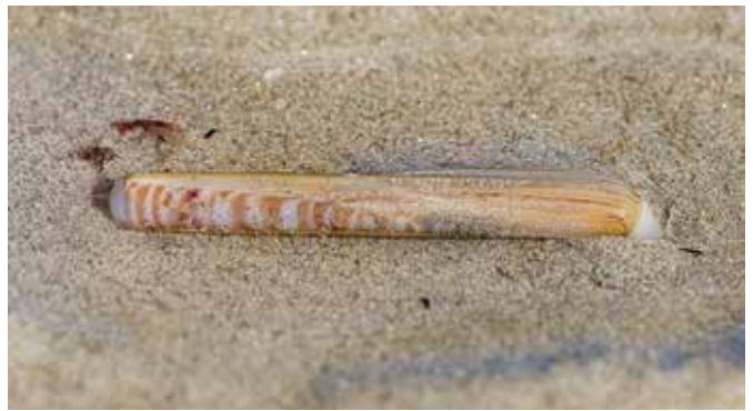
couteau siliquie et enfouissement

Il existe un autre couteau semblable mais toujours plus petit, 4 cm seulement qui reste à rechercher ( Ensis minor ).