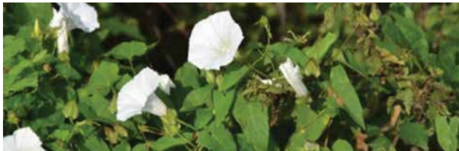
Liseron des haies