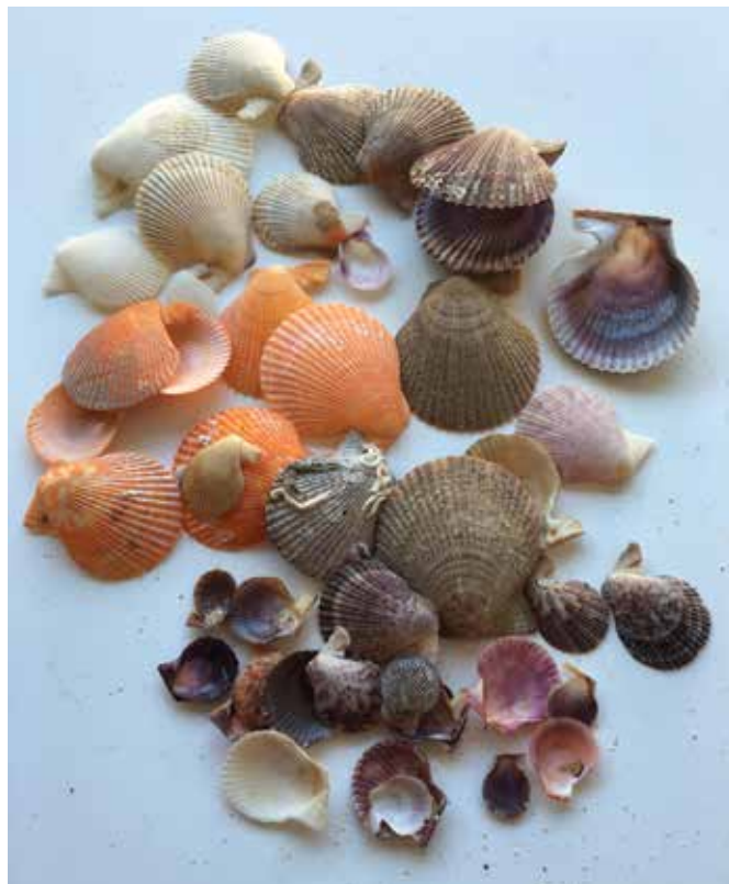
collection Jacquin © Dominique Chevillon