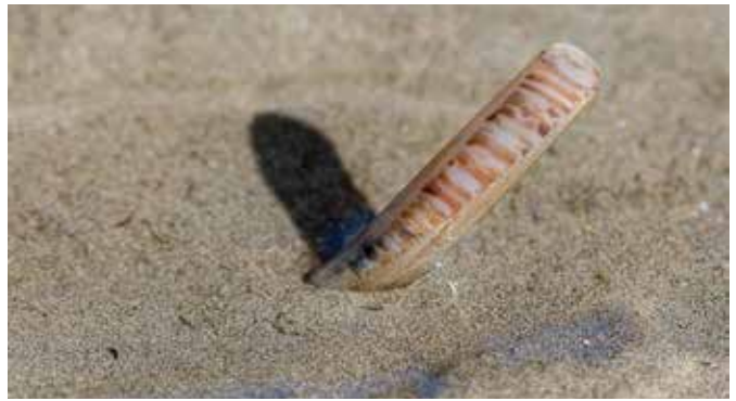
collection Jacquin © Dominique Chevillon